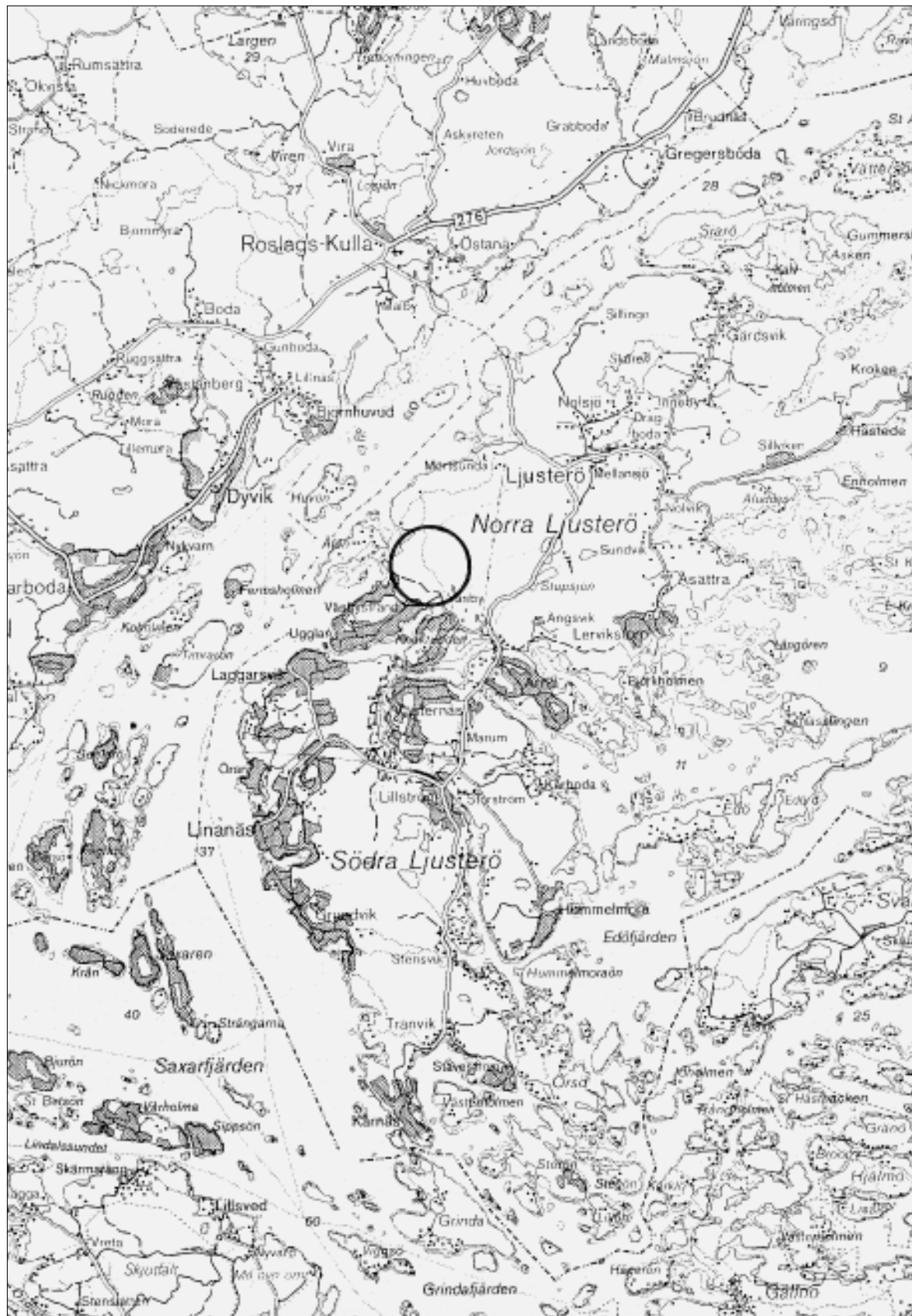
Fig 1. Undersökningsområdets läge markerat på Blå kartan, skala 1:100 000.