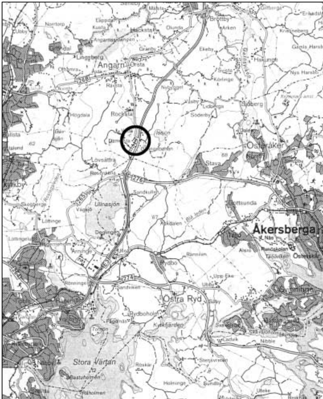
Fig. 1. Undersökningsobjektets läge på Blå kartan, skala 1:100 000.