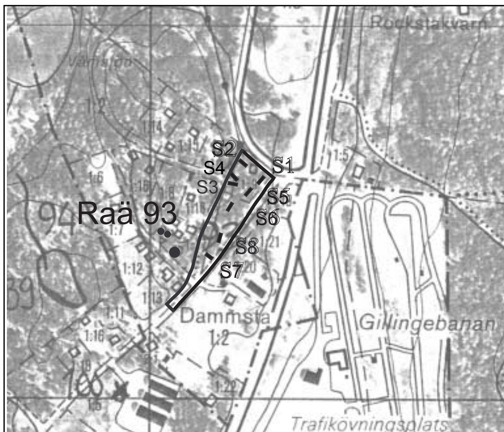
Fig. 2. Ekonomiska kartan 1110 g Angarn, skala 1:5 000.

Den arkeologiska utredningen kunde inte påvisa några spår av fornlämningar inom objekt 1.