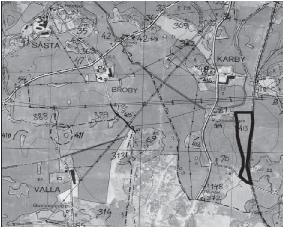
Fig. 1. Undersökningens läge markerat på Ekonomiska kartan 10I 9f Täby, skala 1:10 000.