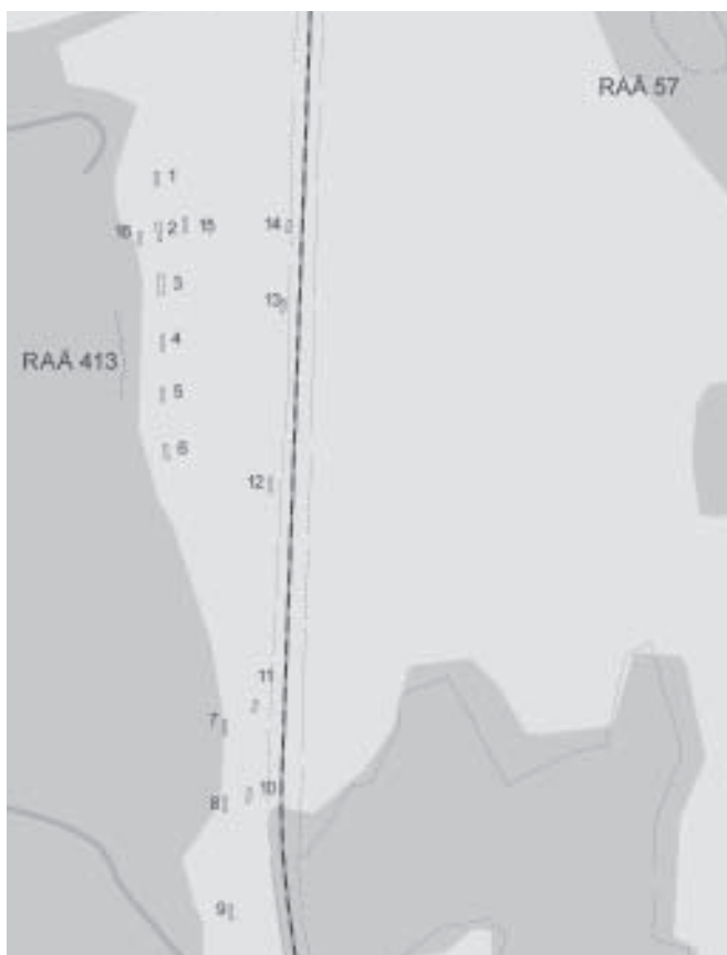
Fig. 2. Schaktens läg. Skala 1:4000