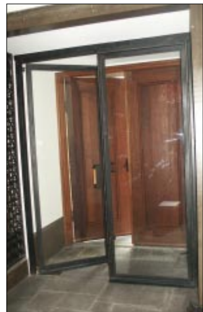
Bildbeteckning: Lp20020032. Det nya vindfånget.