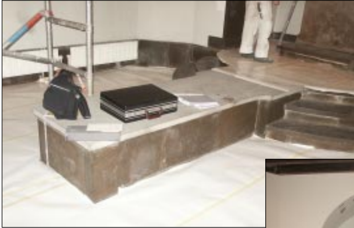
Bildbeteckning: Lp20020033. Katafalken före borttagandet.