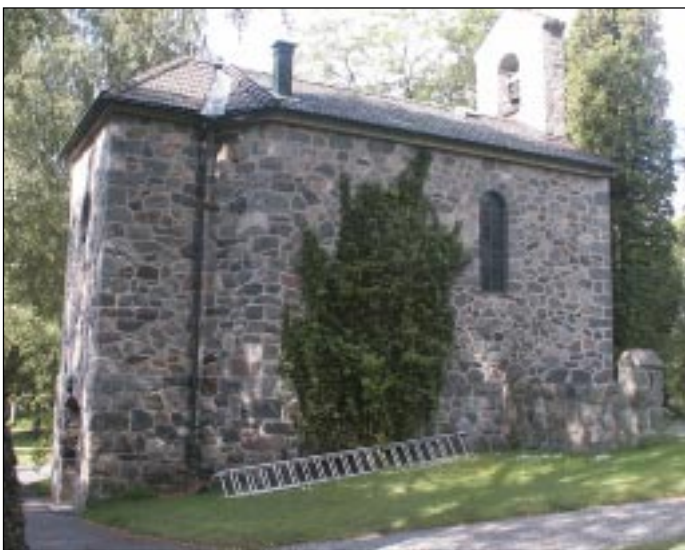
Bildbeteckning: Lp20020034 Gustavsbergs gravkapell, norra längsidan.