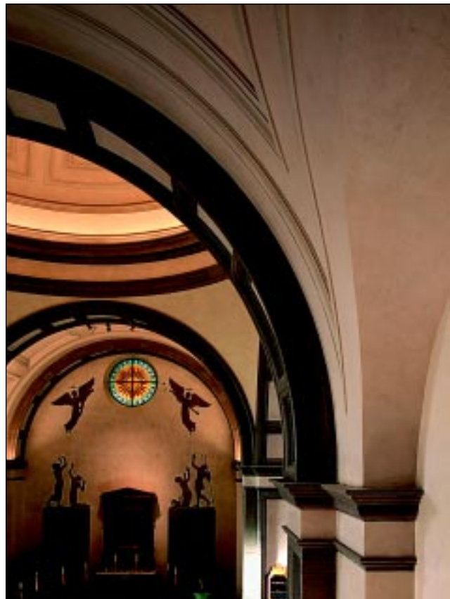
Bildbeteckning: Id20020039. Valvbåge i kalksten.