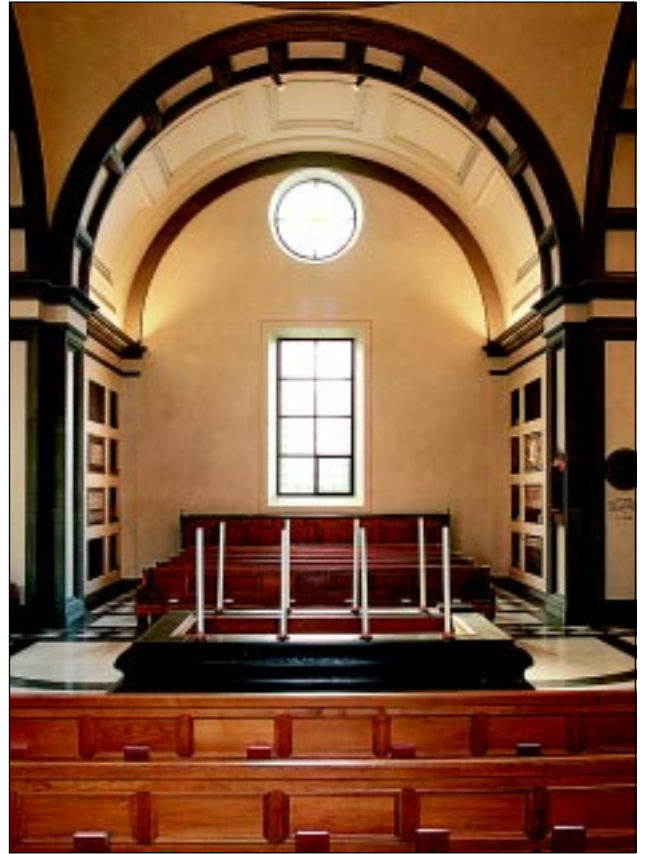
Bildbeteckning: Id20020041. Mot korsarmen.