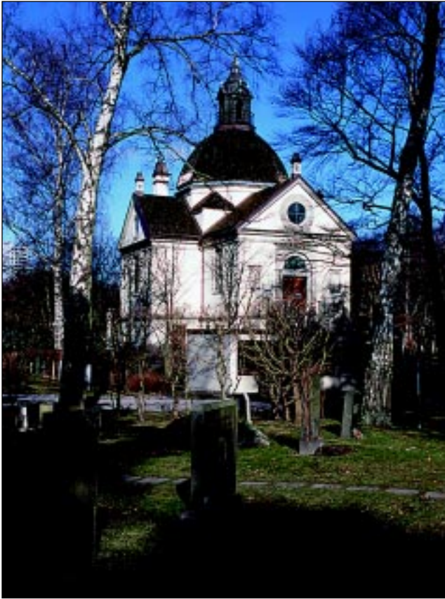
Bildbeteckning: Id20020033. Norra kapellet