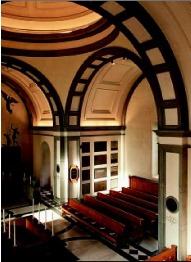
Bildbeteckning: Id20020040. Från orgelläktaren syns bänkinredningen i ek och kolumbarienischerna på väggen.