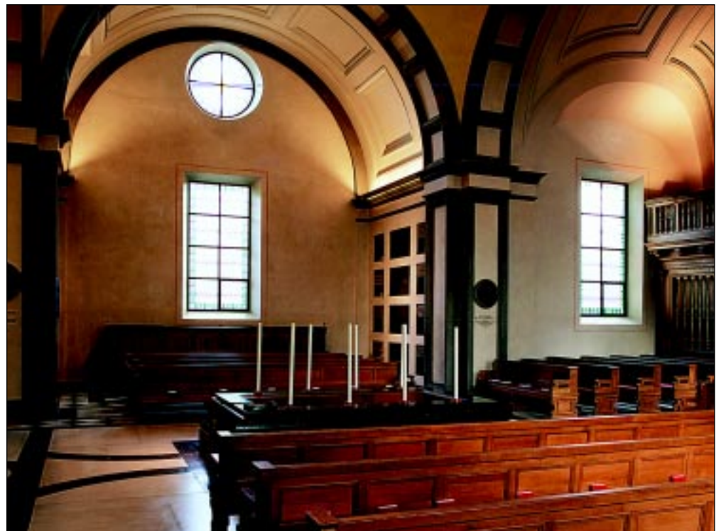
Bildbeteckning: Id20020042. Mot nordöstra korsarmen.