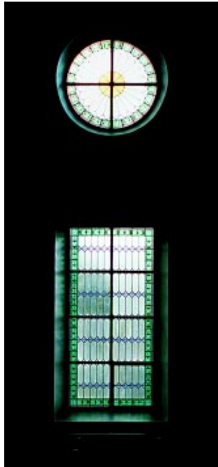
Bildbeteckning: Id20020044. Fönstren med sina färgade glas.