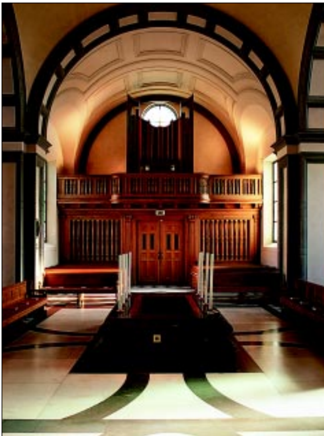
Bildbeteckning: Id20020038. Orgelläktaren i sydost utförd i ek. I förgrunden syns katafalken.