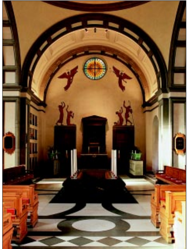
Bildbeteckning: Id20020037. Koret i nordväst med Arvid Knöppels reliefer.