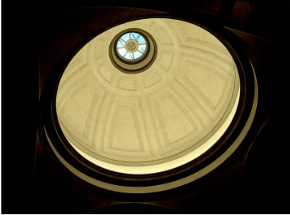
Bildbeteckning: Id20020043. Kupolen med lanterninens återskapade ljusinsläpp.