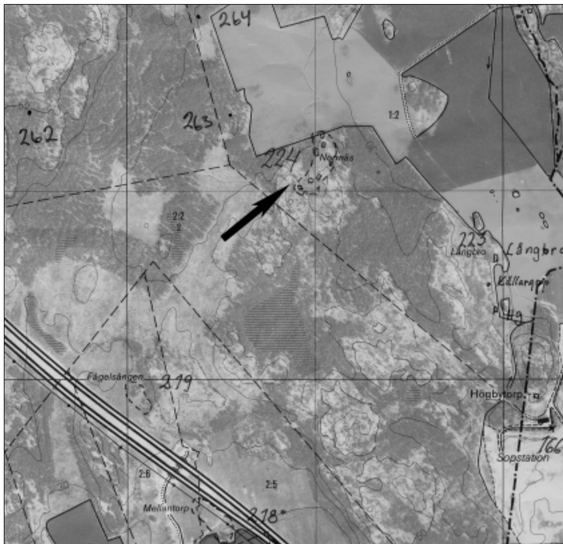
Fig 2. Ekonomiska kartbladet 111 0a Önsta med RAÄ 224/Norrnäs markerat, skala 1:10 000.