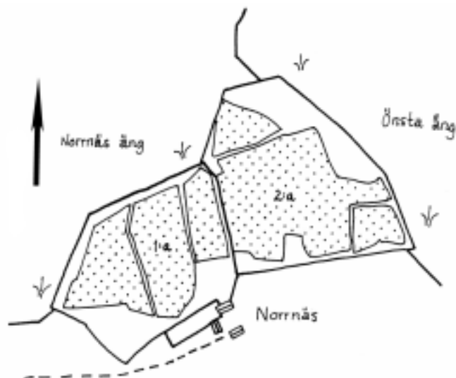
Fig 3. Kartöverlägg av Storskifteskartan, skala 1:4000. Nornnäs 1785, ej rektifierad. Upprättad av K. Andersson.

Några grunder som motsvarar karteringarnas bebyggelse i den norra delen har inte kunnat identifieras med säkerhet, vilket möjligen beror på att bebyggelsen endast är avbildad schablonmässigt eller att ett antal husgrunder