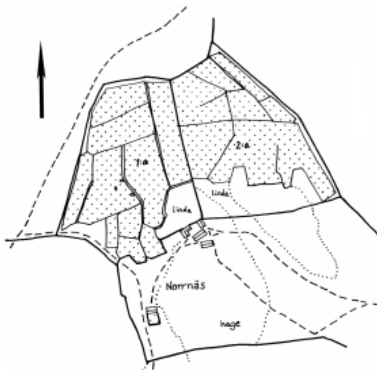
Fig 4. Kartöverlägg av Laga Skifteskartan, skala 1:4000. Nornnäs 1874, ej rektifierad. Upprättad av K. Andersson.