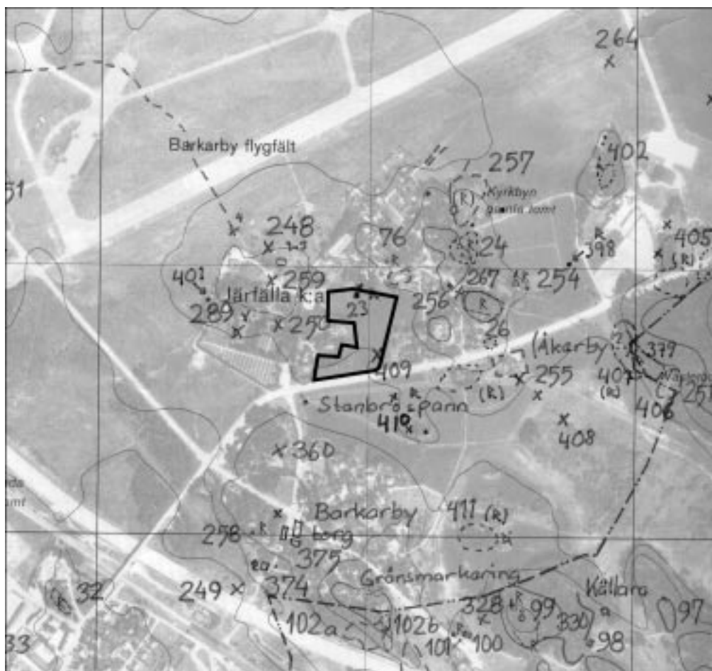
Fig 2. Ekonomiska kartan med utredningsområdet markerat, skala 1:10 000.

och framåt (fig. 2). Under loppet av järnåldern har områdena kring Järfälla kyrka kommit att bli fullt ut koloniserade och by- och gårdsgränserna i har sannolikt förändrats mycket litet från yngre järnålder fram till modern tid. De stora förändringarna i området sker framför allt under 1900-talet i samband med de militära aktiviteterna på Järvafältet och Barkarby flygfält. Den under slutet av 1100-talet uppförda stenkyrkan är uppförd på mark tillhörande det gamla Järfälla by, vilken med all sannolikhet har förhistoriska rötter. (Källman & Nygren 1991:29f).