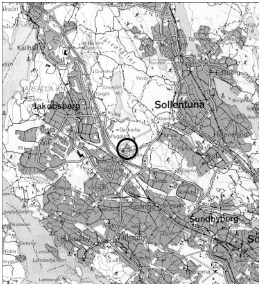
Fig 1. Blå kartan med utredningsområdet markerat, skala 1:100 000.