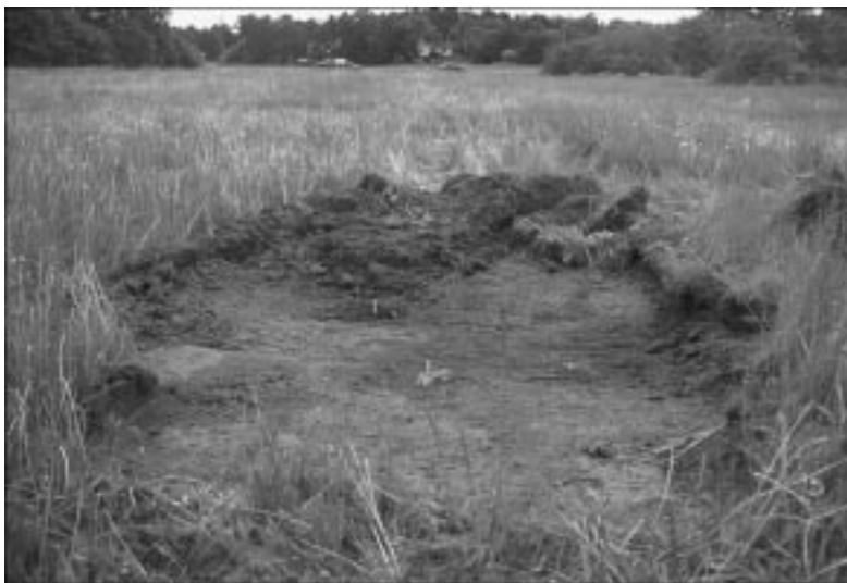
Fig 4. Schakt 7 med stolphål A1 och härd A2.