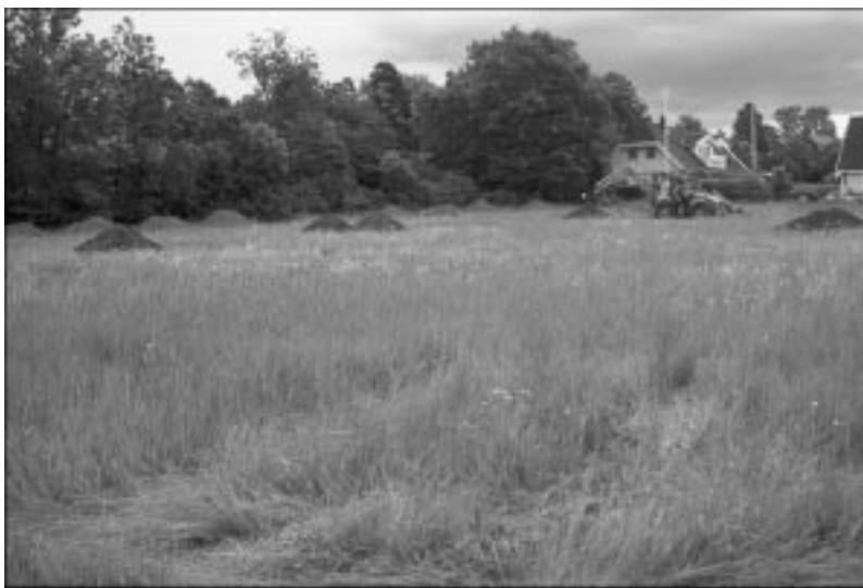
Fig 3. Översiktspådel på del av undersökningsområdet med ett antal schakt upptagna.

Den kompletterande utredningen syftade till att ta reda på om de ytor som tidigare bedömts vara fornlämningsintensiva, innehöll antikvariskt intressanta lämningar eller ej (bil. 1). Med en grävmaskin försedd med planskopa grävdes sökschakt på de aktuella ytorna ned till en fyndförande nivå eller till anläggningsnivå där detta påträffades. Annars grävdes det ner till en nivå som bedömdes vara opåverkad av människa. Ett antal sökschakt grävdes även mellan de tidigare avgränsade ytorna. De grävda schakten handrensades i syfte att lättare kunna urskilja eventuella kulturlager eller konstruktioner.