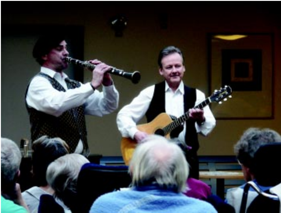
Musikaktivitet med Kultur i vården.

Stockholms läns landsting har sedan 1980-talet bedrivit Kultur i Vården i olika former. Kulturförvaltningen bedrev till en början kulturverksamhet tillsammans med arbetsförmedlingen. 1994 ändrade vi inriktning och tar nu fram en programkatalog, som innehåller ett varierat utbud av god kvalitet. Katalogen för 2002 innehåller ca 85 grupper inom olika genrer. Katalogen vänder sig i första hand till patienter som vistas en längre tid på någon av landstingets institutioner. Huvudsakliga målgrupper är barn, psykiatri och geriatrik. Programmen är även tillgängliga för kommunala och privata enheter.