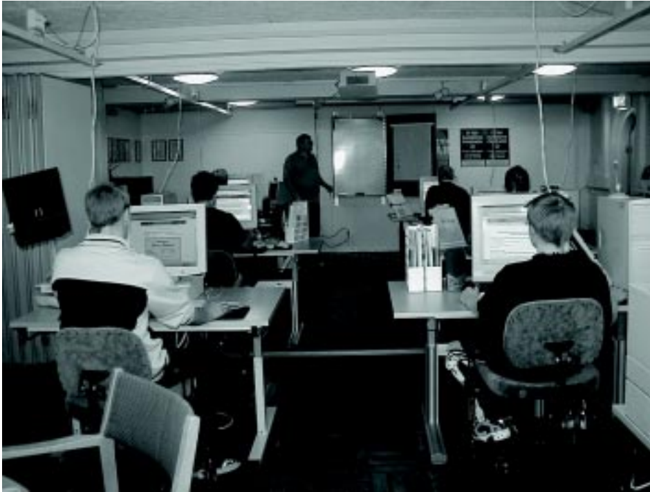
IT-caféet i Hemse.

ombuden som är vanliga anställda i omsorgen med särskilt uppdrag bl.a. att läsa högt för de boende på gruppboendena. Läsombuden är utbildade i studiecirkelform och får också varje år vidareutbildning. Läsombudens inriktning har utvidgas genom åren från lättlästa böcker och nyheter till annan kultur, samhällsinformation och verktyg för detta.