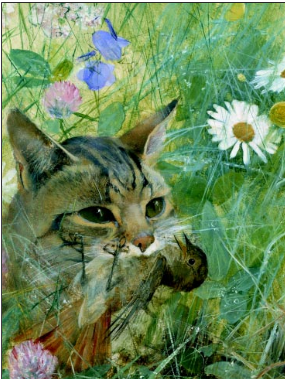
Bruno Liljefors, Katt med rödstjertunge i munnen (bilden är något beskuren).