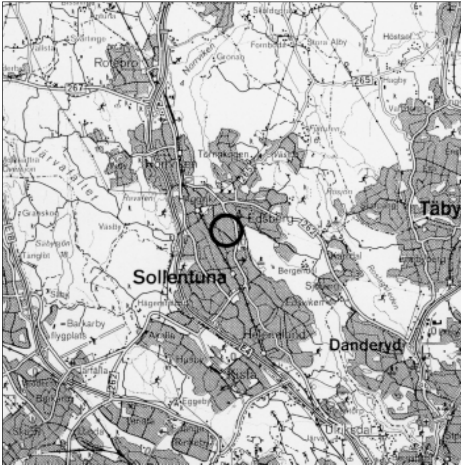
Fig 1. Undersökningsområdet markerat på Blå kartan, skala 1:100 000.