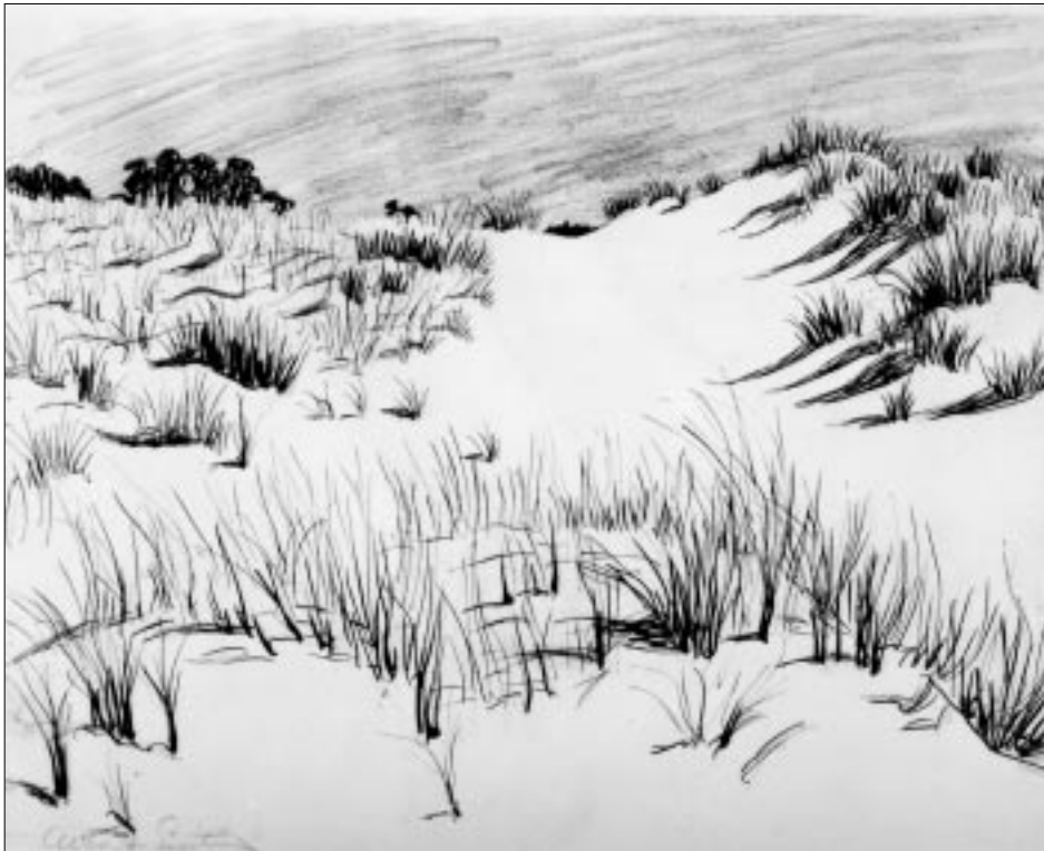
Sanddyner. Albert Engström (1869-1940).