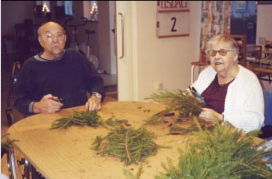
Här binds det julkransar. Pär's Trädgård, trädgårdsgruppen.

undersköterskor, rehabiliteringsbiträde och arbetsterapeut som har planeringsmöten en gång/månad. Trädgårdsgruppen planerar och engagerar patienter, undersköterskor och anhöriga till aktiviteter i trädgården året runt.