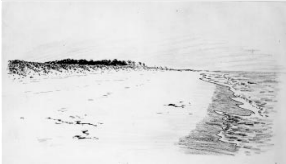
Det sista av en dynning. Gotska Sandön 1929. Albert Engström (1869-1940).