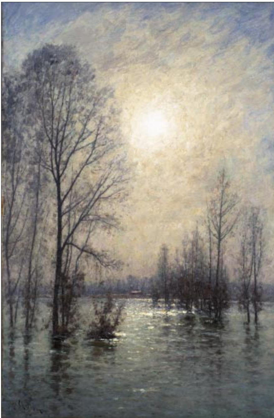
Översvämning, motiv från Ile S:t Ouen. Per Ekström 1889.