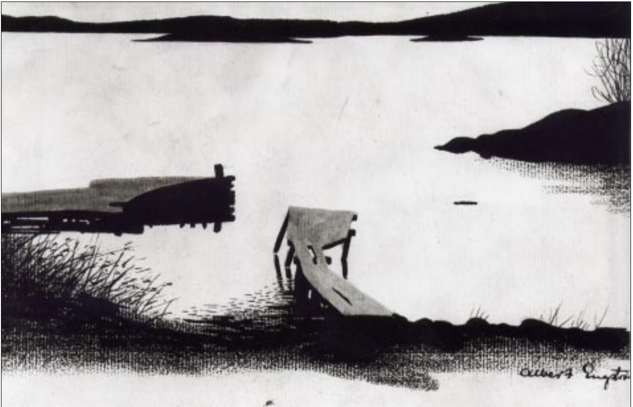
Skärgård. Teckning för Strix 1901. Penna, svart bläck och krita. Albert Engström (1869-1940).