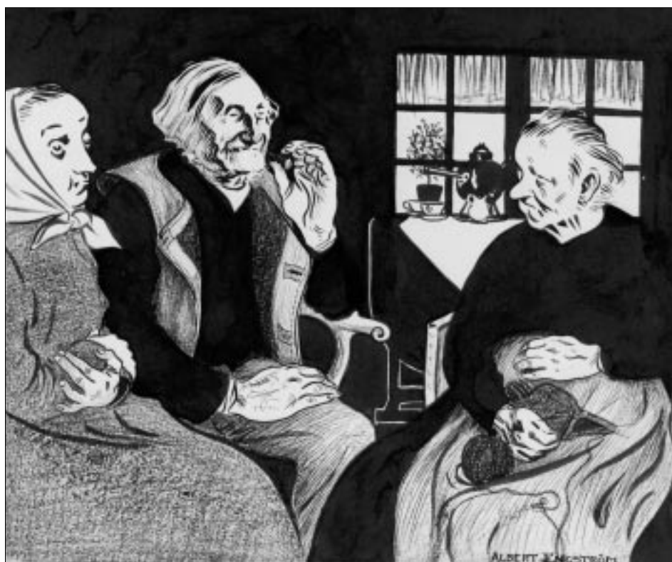
Teckning med gamla. Strix 1901. Penna, svart bläck och krita. Albert Engström (1869-1940).