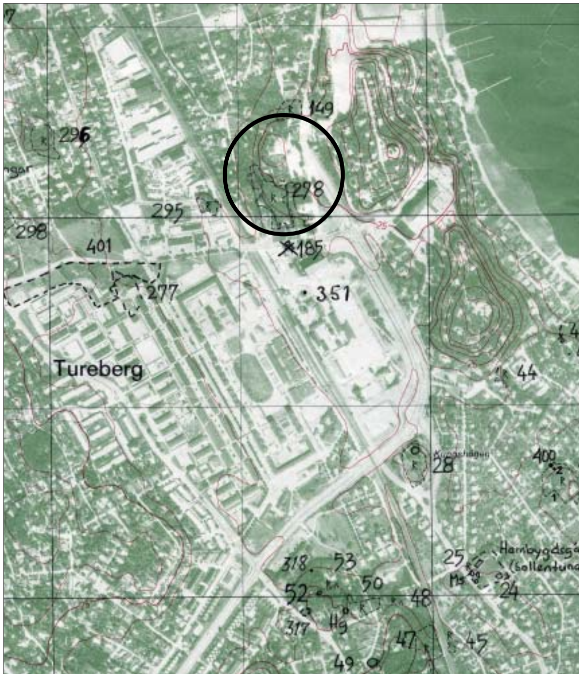
Fig 1. Undersökningsområdet markerat på ekonomiska kartans blad 12J Od Älmsta. Skala 1:10 000

Stockholms läns museum utförde under september månad 2003 en arkeologisk förundersökning i form av schaktkontroll vid grävning för kabelnedläggning strax norr om Raä 278, Sollentuna socken. Raä 278 utgörs av ett gravfält med ca 90 synliga lämningar. Fornlämningen är tidigare delundersökt där det förutom gravar också framkom boplatsoanläggningar (Carlsson m fl 1996). Fornlämningen är komplex och det bör anses som en stor risk att dess utbredning är större än nu känt. Uppdragsgivare vid föreliggande undersökning var Sollentuna energi.