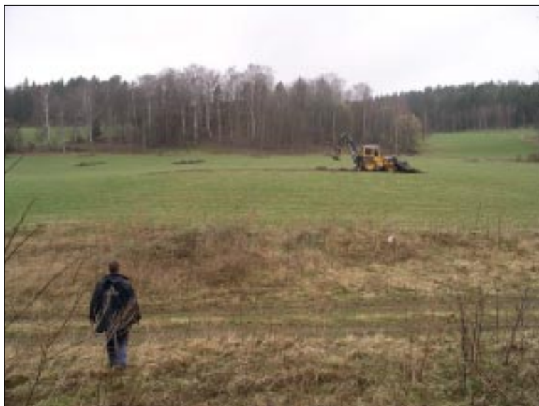
Fig 4. Igenläggning av schakt 18 efter avslutat fältarbete.

delar och gravfältet RAÄ 189. Denna ligger drygt 10 meter högre än UO och utgör ett gynnsamt boplatssläge i direkt anslutning till gravfältet. Höjdplatåns sydöstra sida har sannolikt schaktats ur i samband med grus- eller sandtäkt vid något tillfälle.