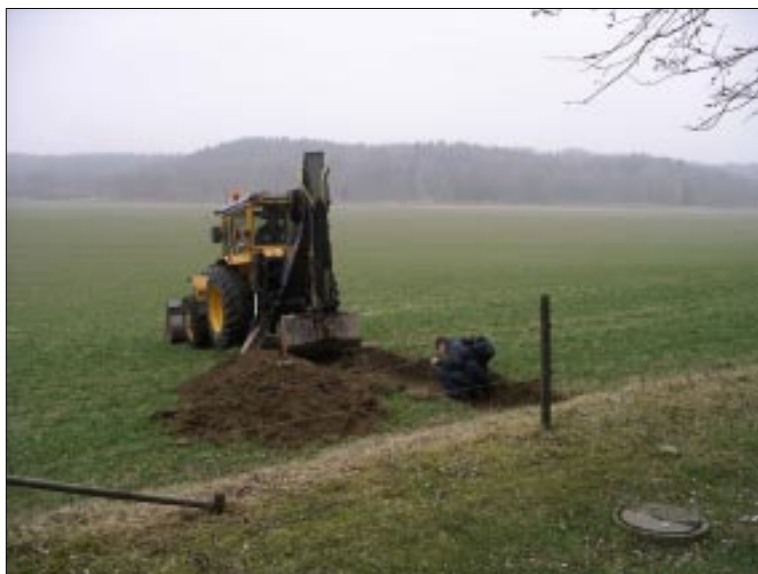
Fig 3. Sökschaktning i utredningsområdets sydvästra del (S5).