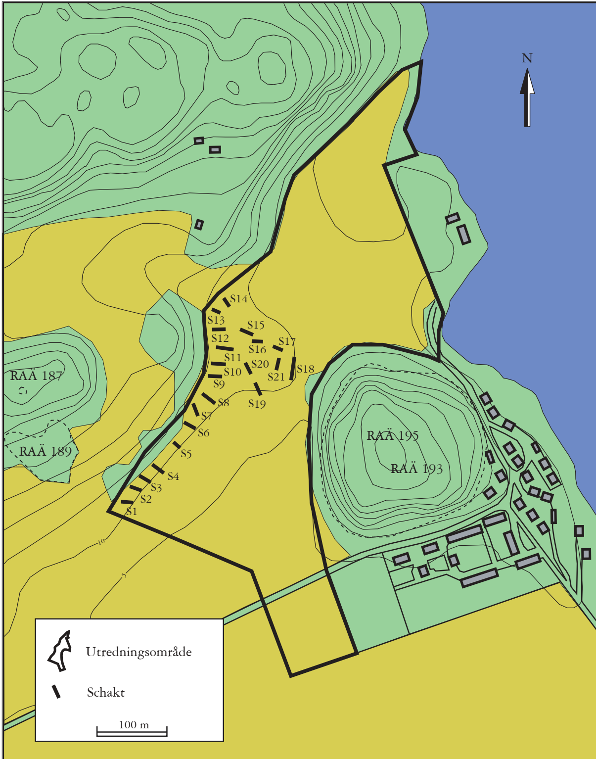
Fig 4. Schaktplan. (Schaktens storlek har överdrivits för läsbarheten). Kartan upprättad med Ekonomiska kartan som grund av Richard Grönvall.