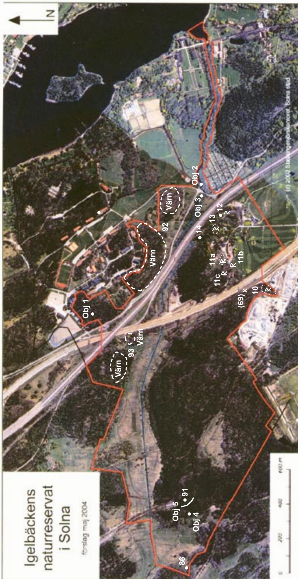
Fig. 2. Fornlämningarna i området kring Överjärva gård utgörs främst av gravar och gravfält.