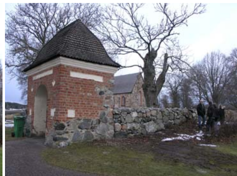
Omsatt mur i anslutning till stigluckan. till Bildnr: lp20051395.