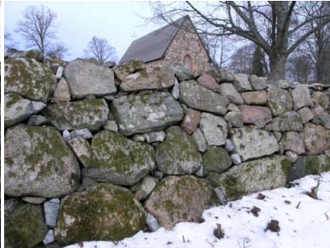
Omsatt del av östra muren med komplettering av kilsten.