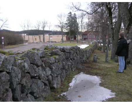
Omsatt del av norra murens insida.