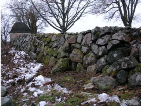
Sättningskador i östra muren.