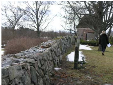
Omsatt del av östra murens insida.