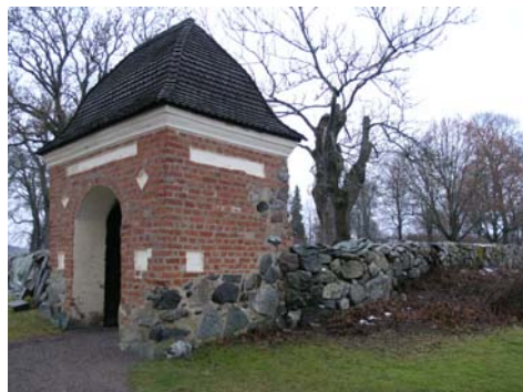
Sättningskadad mur i anslutning till stigluckan. Bildnr: lp20051396.