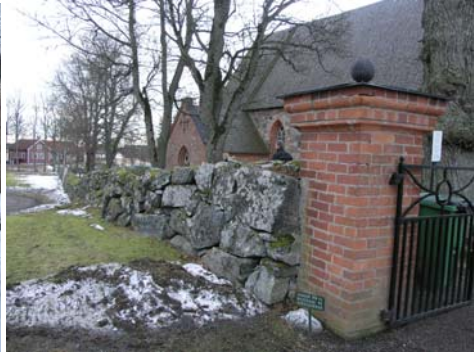
Omsatt del av norra muren.