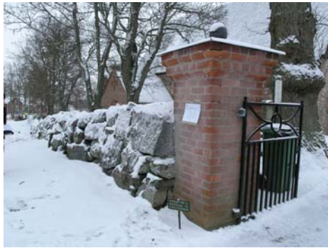
Sättningskador i norra muren.