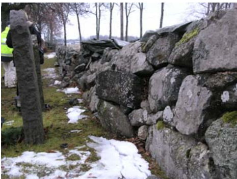
Sättningskador i östra murens insida.