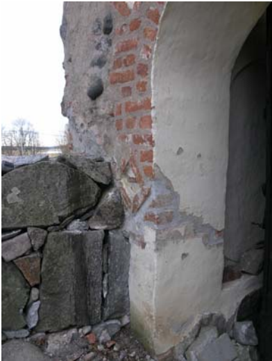
Putslagning av sprickbildning i stigluckan. Bildnr: lp20051390.