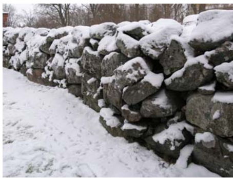
Sättningskada i norra murens insida.