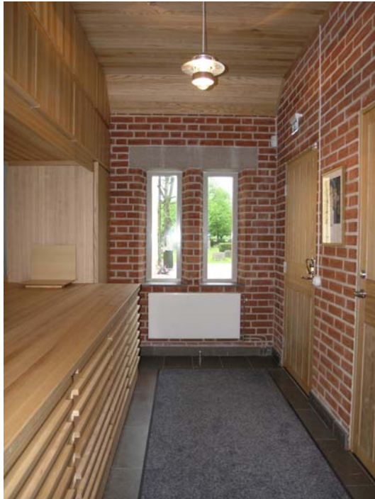
Interiör med skåp för textilförvaring i den tillbyggda sakristian.