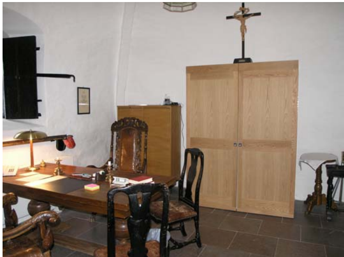
Sakristian med nytt golv av gotlandskalksten och nytt skåp för skrudförvaring.

Sakristians befintliga skåp har avlägsnats. I dess ställe har placerats ett nytt säkerhetsskåp av märket HÅBECO Kyrkskåp samt ett nytt träskåp för skrudförvaring efter ritningar av Arkitekt Stensson AB och M2 Arkitekter AB.