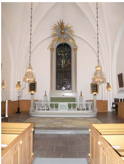
Interiör mot öst efter restaurering.

Väggar och valv har målats i enlighet med 1800-talets färgsättning. Väggyornas befintliga alkydoljefärg tvättades och målades med kalkvit emulsionsfärg av fabrikket Wibö.