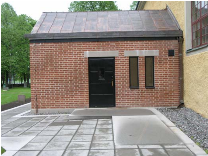
Tillbyggnad till sakristia i norr.