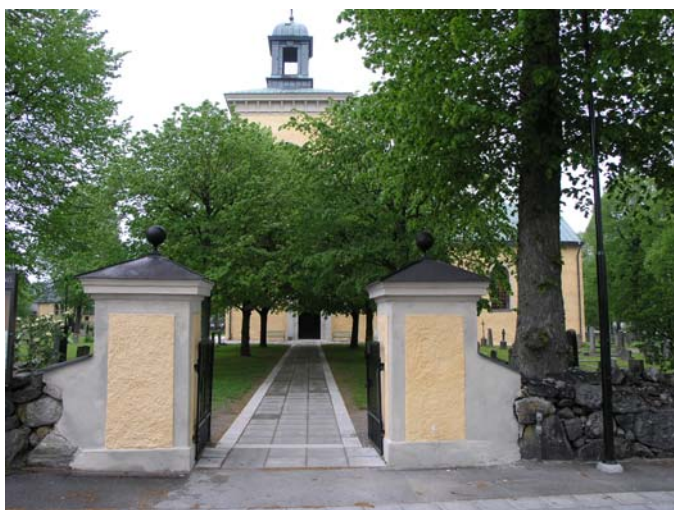
Gången från södra entrén har lagts med betongplattor.

Foto: Lisa Sundström, 2005-06-03. Bildnr: lp20051429