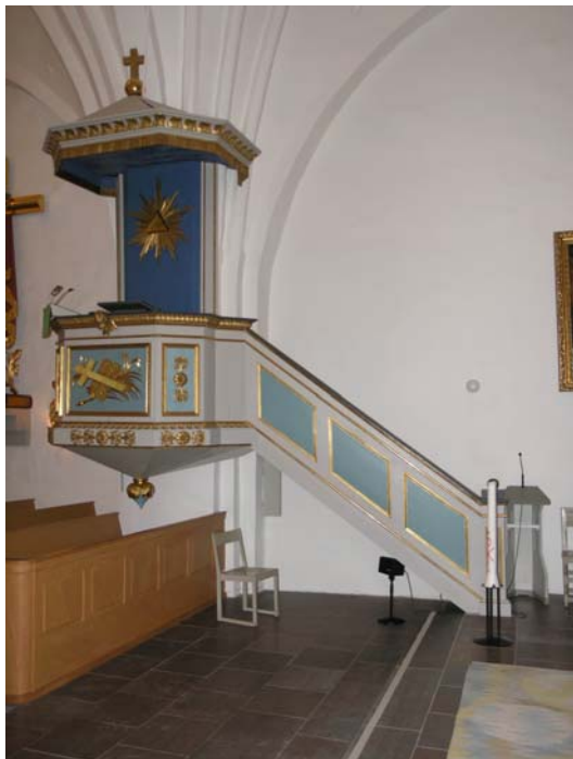
Predikstolen efter restaurering.