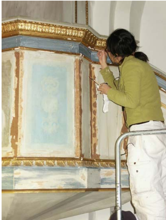
Predikstolen under restaurering. Bildnr: lp20051421