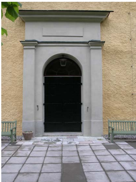
Sydportalen samt läggning av betongplattor.

Foto: Lisa Sundström, 2005-06-03. Bildnr: lp20051429