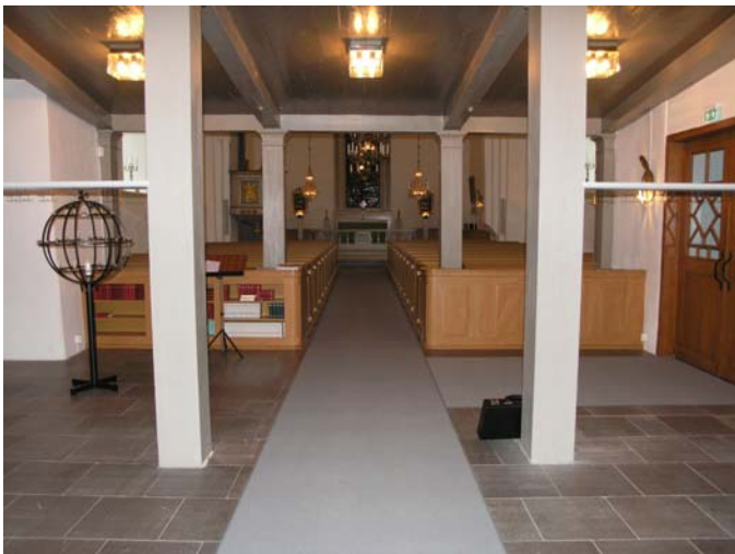
"Kyrktorget" i långhusets västra del.

Foto: Lisa Sundström, 2005-06-03. Bildnr: lp20051413