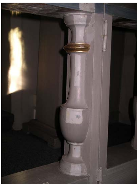
Altarringens ursprunglig färgsättning skrapades fram. Bildnr: lp20051426