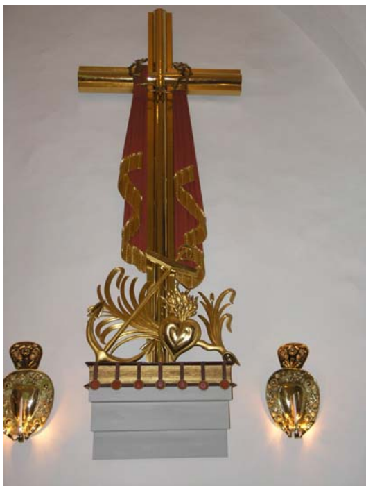
Krucifixet från 1840-talets altarpupp restaurerades och placerades på långhusets norra vägg.

Ett äldre krucifix från 1840-talets altarpupp har efter konservering återförts till kyrkorummet och placerats på långhusets norra vägg.