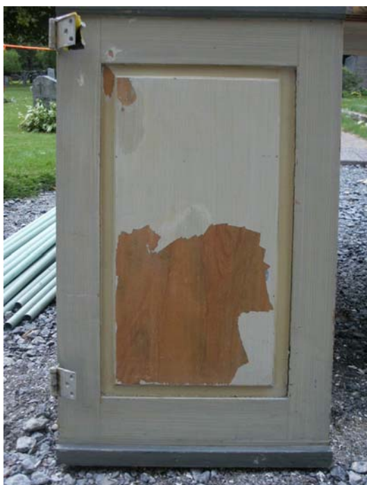
Bildnr: lp20051423

Bänkdörrarnas ursprunglig färgsättning skrapades fram.