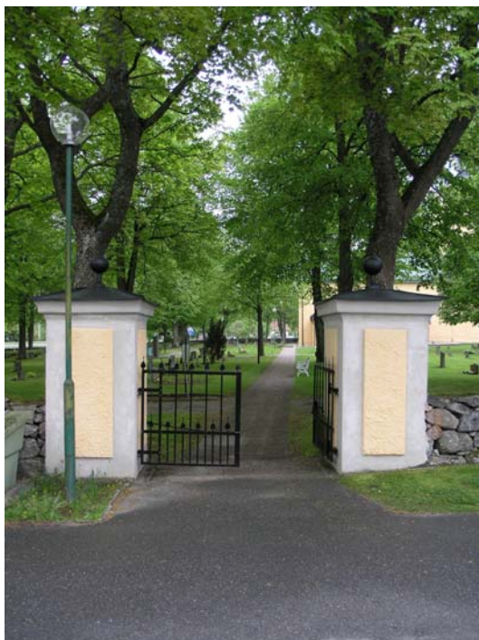
Norra grindstolparna. Bildnr: lp20051408

Grindstolparna har putslagats och avfärgats lika kyrkans fasadbehandling. Avvattning och smide har setts över och renoverats. En plåtkula saknades och nyttillverkades.