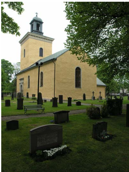
Västerbaninge kyrka från syd-öst.

Foto: Lisa Sundström, 2005-06-03. Bildnr: lp20051404