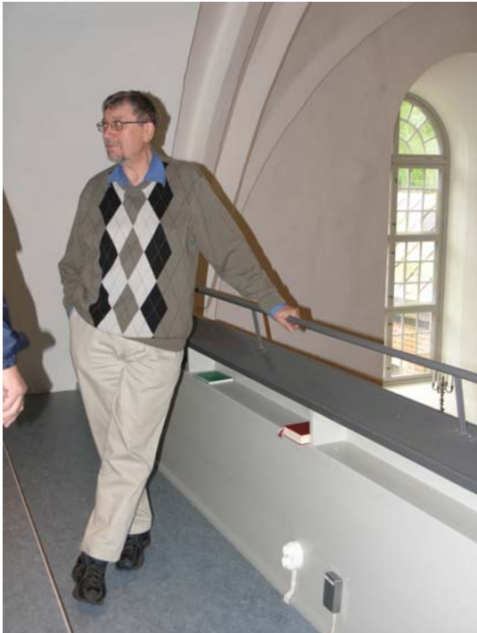
Läktarbarriären har kompletterats med säkerhetsräcke.