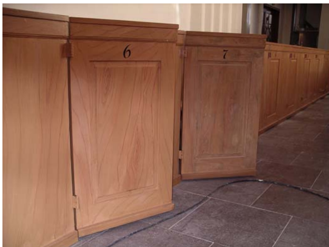
Bänkinredningen efter restaurering. Bildnr: lp20051425