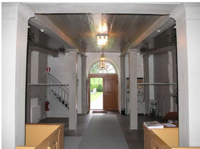
"Kyrktoget" i långhusets västra del.

Foto: Lisa Sundström, 2005-06-03. Bildnr: lp20051415