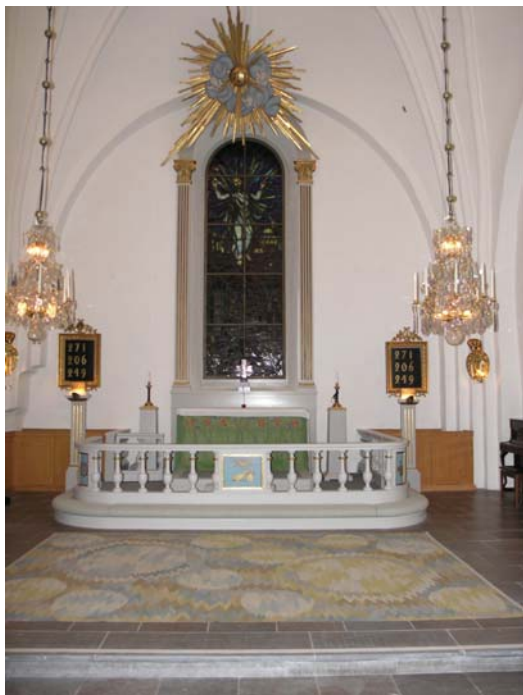
Korets åt öster.

Korets stengolv har breddats ca 40 cm mot långhuset.