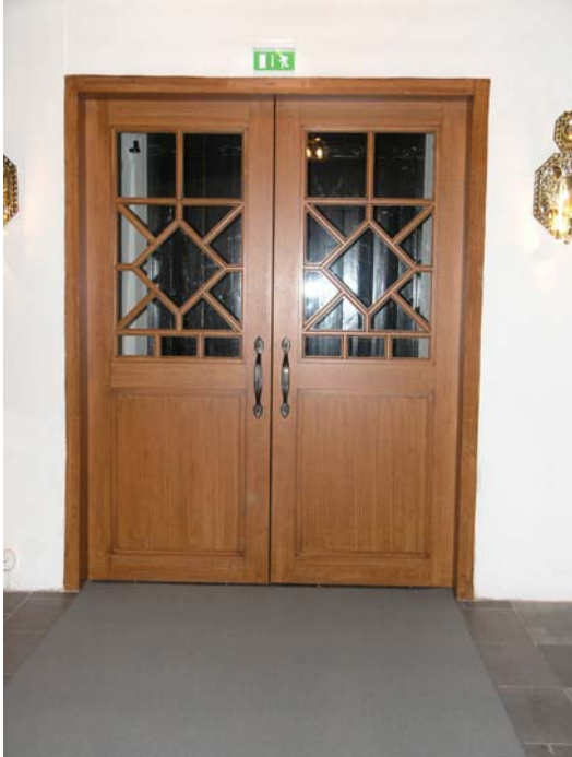
Nyttillverkad dörr till sydportalen.

Foto: Lisa Sundström, 2005-06-03. Bildnr: lp20051413