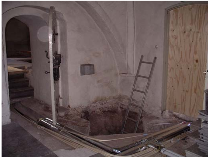
Undersökning av källare under sakristan. Bildnr: lp20051418

Efter undersökning av golvet lades ett nytt golv i sakristian med plattor av grå gotlandskalksten från Slite.