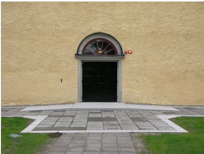
Västportalen samtläggning av betongplattor och handikappramp.

Marken kring kyrkan lagts med grovt singel. Grusgången från nybyggnaden via västporten till sydporten har lagts med betongplattor. Entréytan vid västra portalen har handikappanpassats.