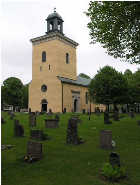
Västerhaninge kyrka från syd-väst efter restaurering.

Kyrkan har försetts fasadbelysning genom armatur på kyrkogården.