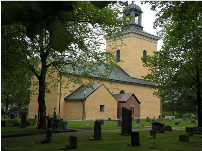
Västerbaninge kyrka från nord-öst med tillbyggnad av tegel.