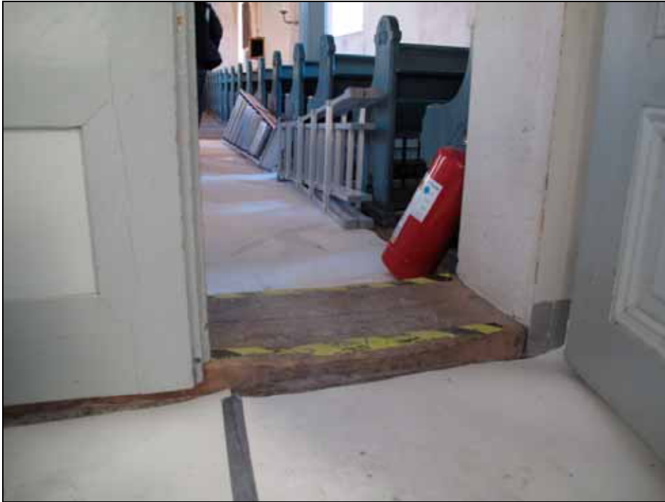
Tröskeln mellan vapenhus och kyrkorum avlägsnades av tillgänglighetskäl, bildnr: lp20110950.