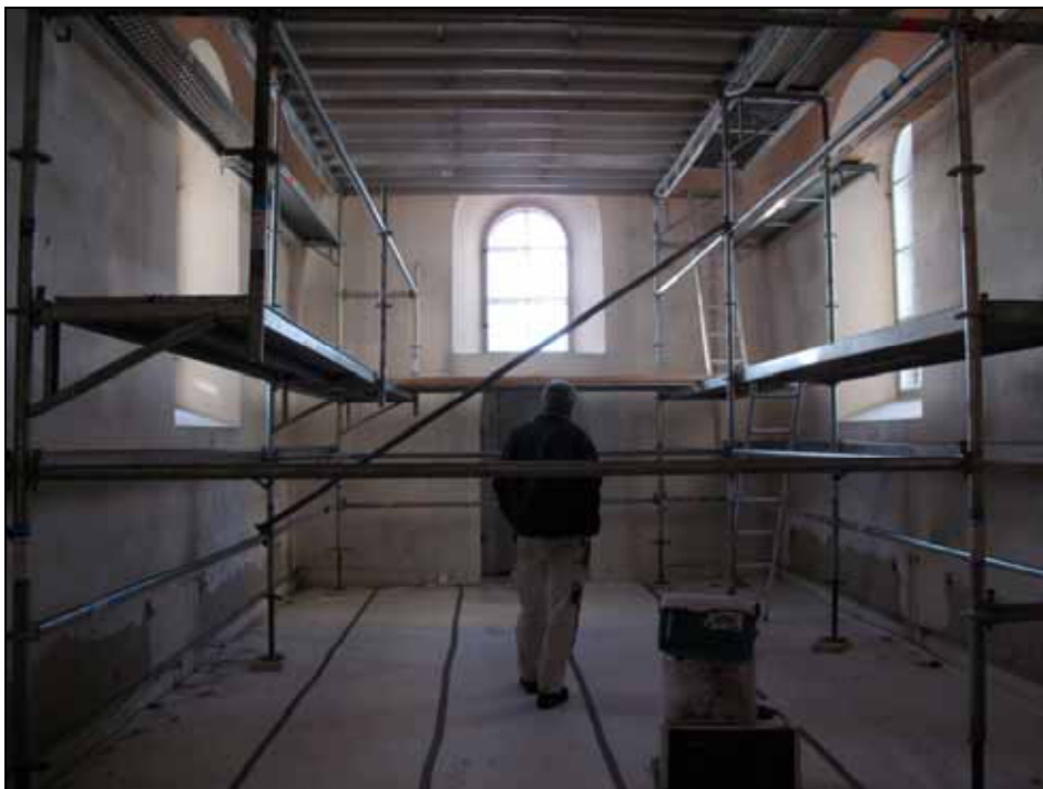
Södra tvärarmen under pågående konserveringsarbete, foto: Cecilia Pantzar, bildnr: lp20110948.