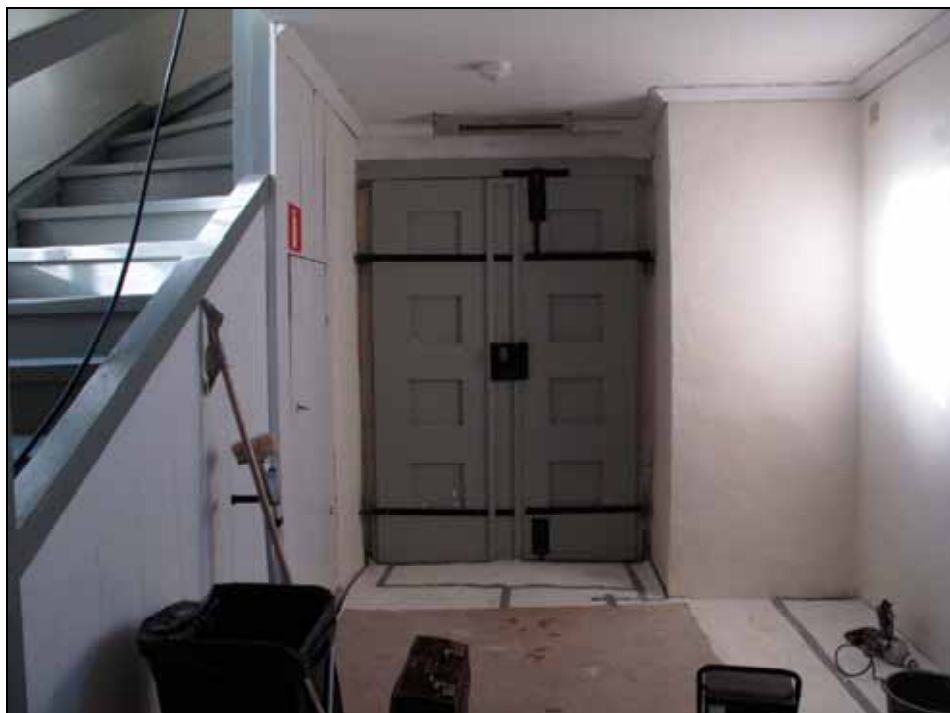
Vapenhuset med ytterdörr åt väster efter väggrengöring men före målning av snickerier, foto: Cecilia Pantzar, bildnr: lp20110952.