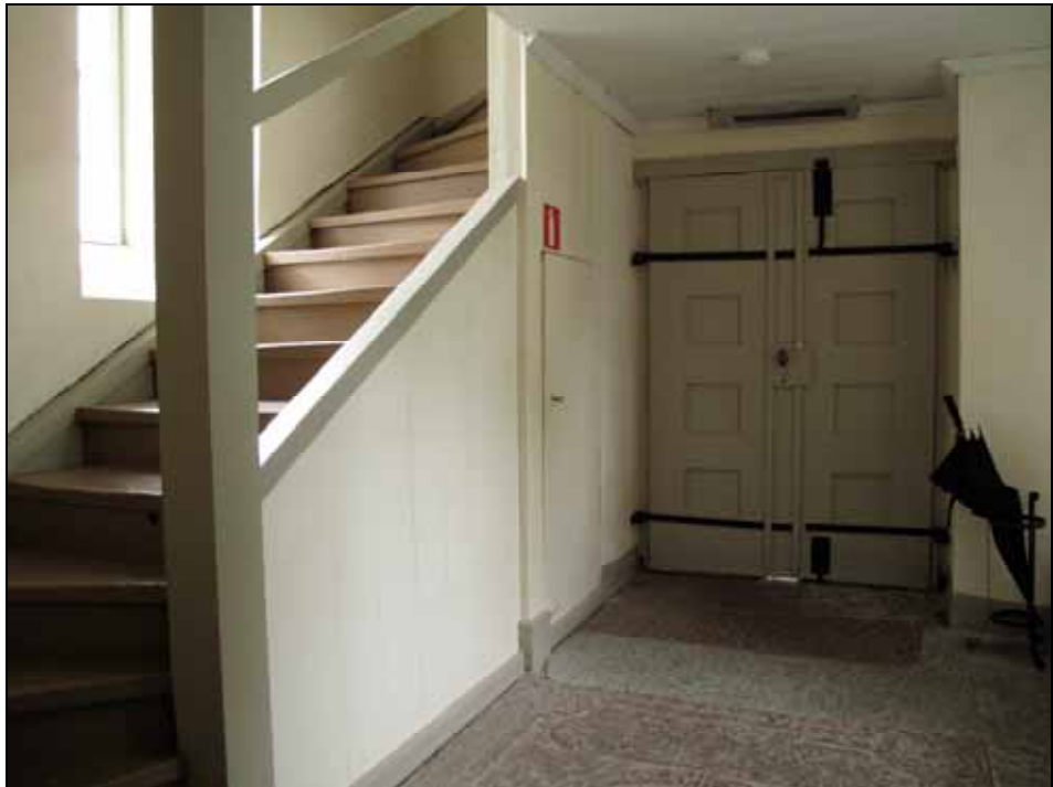
Vapenhuset med västportalens entrédörr och torntrappan. Foto: Lisa Sundström, bildnr: lp20110953.