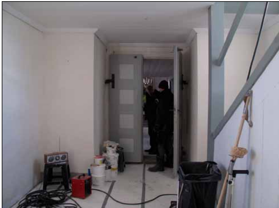
Vapenhuset in mot kyrkan. Väggar är rengjorda och målning av snickerier pågår. Pardörren målades enhetligt ljusgrå, bildnr: lp20110951.