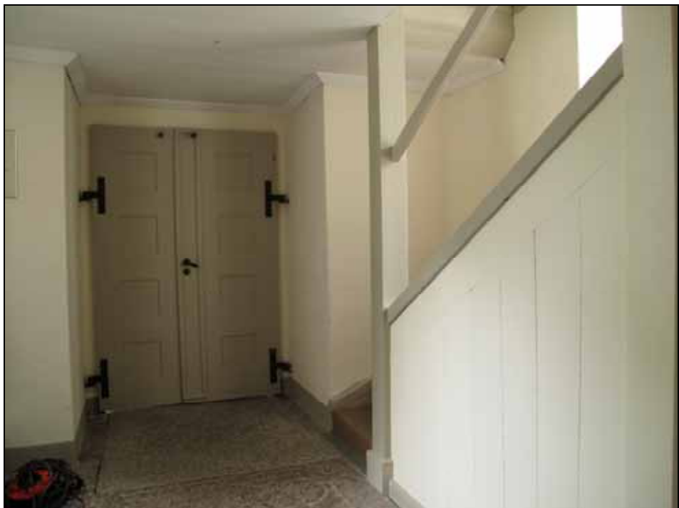
Vapenhuset med entrédörr till långhuset. Foto: Lisa Sundström, bildnr: lp20110954.