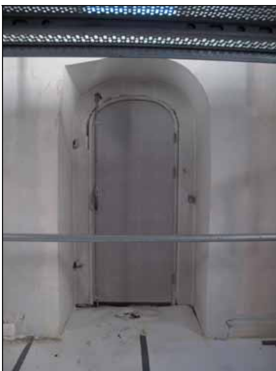
Tvärarmens ytterdörr före byte, foto: Cecilia Pantzar, bildnr: lp20110949.